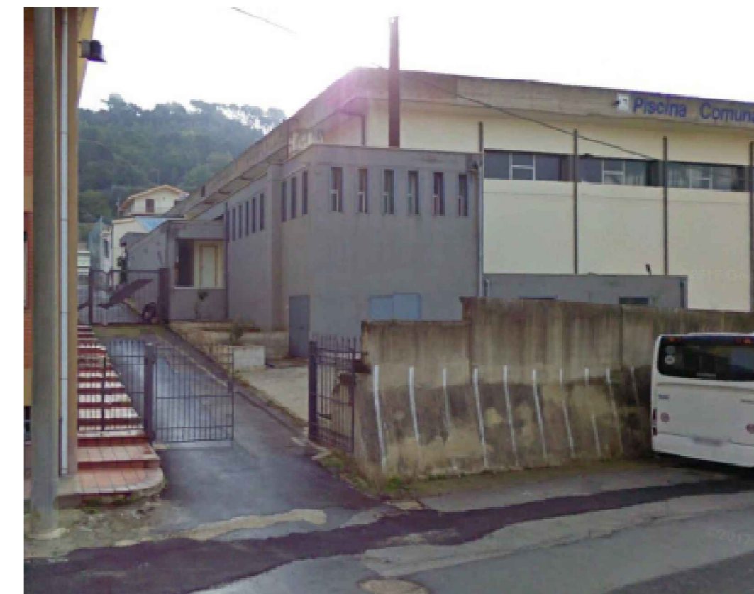
INGRESSO IMPIANTI SPORTIVI