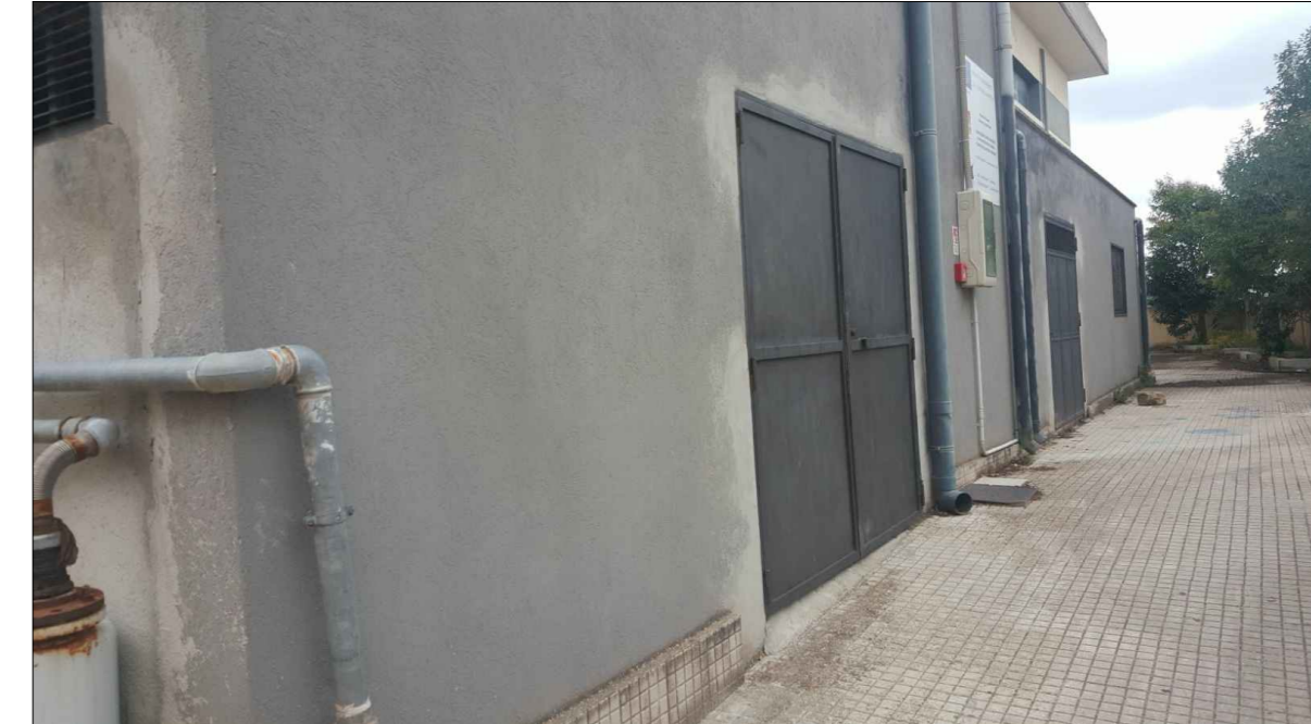
LOCALI TECNICI ESISTENTI